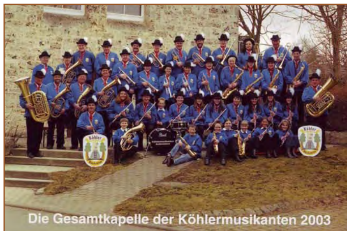
Die Gesamtkapelle der Köhlermusikanten 2003