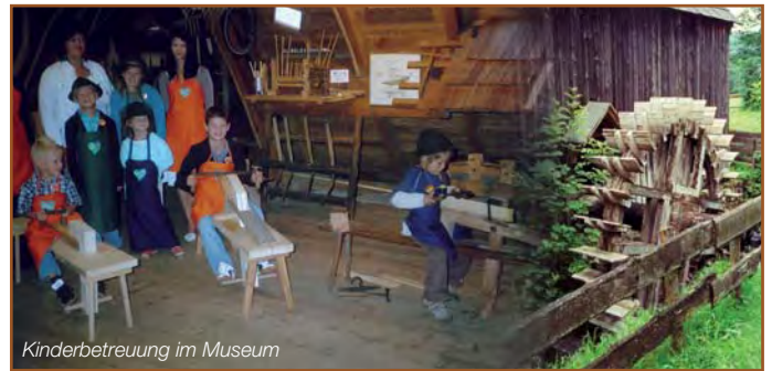
Kinderbetreuung im Museum