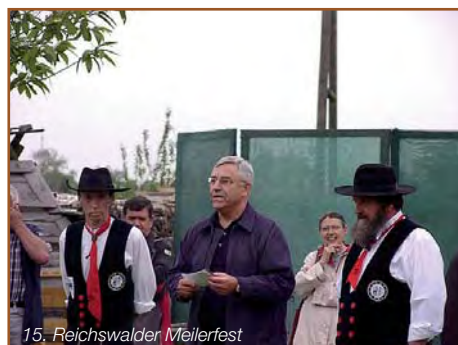
15. Reichswalder Meilerfest

Die Köhlergemeinschaft Reichswalde widmet sich der Brauchtumpflege. Sie möchte das Handwerk des Köhlers in seiner ursprünglichen Form darstellen, denn schon vor zweitausend Jahren, zur Zeit der Römer, wurde bereits am Niederrhein geköhlet. Im Jahre 1992 wurde der erste Meiler in Reichswalde angefeuert. Die Köhlerei ist seither zur Tradition geworden und ein schöner Anlass, alle zwei Jahre im Frühjahr ein Meilerfest zu feiern. Eine Ausstellung über das Köhlerhandwerk ist immer erster Bestandteil der Führungen mit unseren Gästen. Wir erklären ihnen das alte Köhlerhandwerk anhand von Bildern und Schaufafeln und können darüber hinaus vieles am Meiler selbst vorführen. So wird eindrucksvoll gezeigt, wie der Köhler durch harte Arbeit Holzkohle gewinnt. Auch können wir zahlreiche Besucher aus den Niederlanden und dem Ruhrgebiet begrüßen, die sich über die Köhlerei informieren möchten, und bei uns Köhlern mit unseren Helfern einige schöne Stunden erleben dürfen. Sehr gefreut haben wir uns über das Grußwort unseres Ministerpräsidenten Dr. Jürgen Rüttgers NRW zum dies-