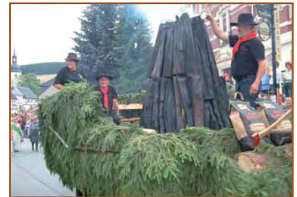
Köhlerverein Erzgebirge zum Festumzug 800 Jahr Sosa

Nach mindestens 100 Jahren gab es wieder einen traditionellen Erdmeiler, der gemeinsam von der Bergbrüderschaft Sosa und dem Köhlerverein Erzgebirge betrieben wurde. Viele Besucher würdigten das Vorhaben mit großem Interesse. Der Erlös aus dem Verkauf der