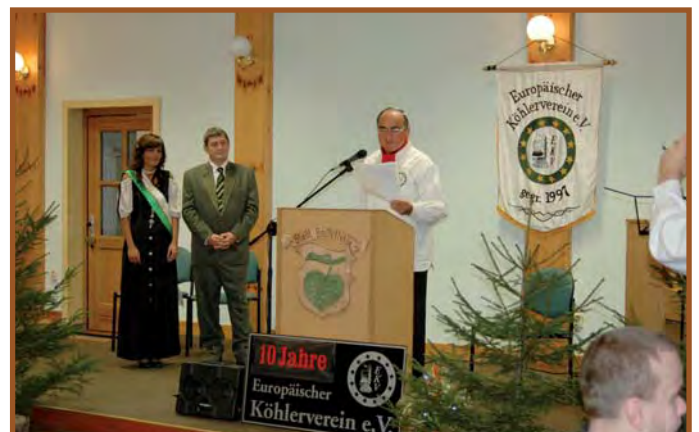
Festveranstaltung in Hasselfelde

Dafür lasst uns gemeinsam auch in Zukunft in Europa sorgen!